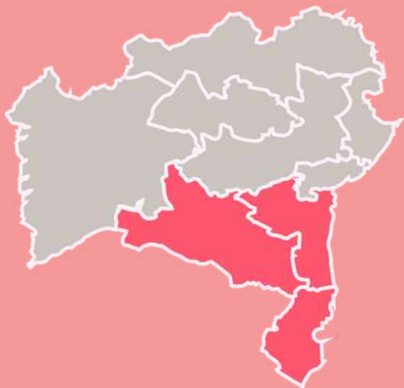
Mapa da macrorregião da Bahia