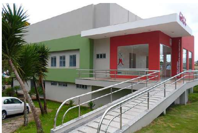
Ambulatório Onco- Hematologia Pediátrica da Santa casa de Misericórdia de Itabuna