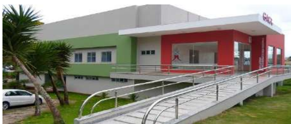
Ambulatório de Onco- Hematologia Pediátrica da Santa Casa de Itabuna