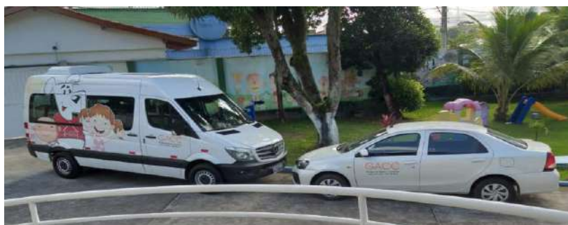
Transporte Solidário Gacc Sul Bahia

4.7.1 - Rota Solidaria – transporte oferecido às crianças e adolescentes que realizam tratamento oncológico e são assistidos pela instituição Gacc Sul Bahia residentes no município de Itabuna-Ba, oferecendo tranquilidade, segurança a caminho das consultas e quimioterapias no ambulatório de onco- Hematologia Pediátrica da Santa casa de misericórdia, exames, e a todos procedimentos acima citados, garantindo a continuidade ao tratamento oncológico das crianças e adolescentes de Itabuna, que por muitas vezes pela vulnerabilidades sociais pesam em desistência.