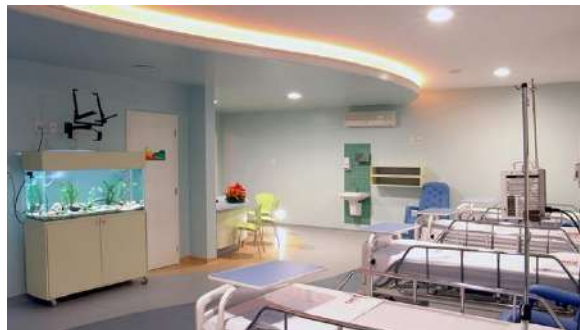
Oncoped(enfermaria No Hospital Manoel Novais)