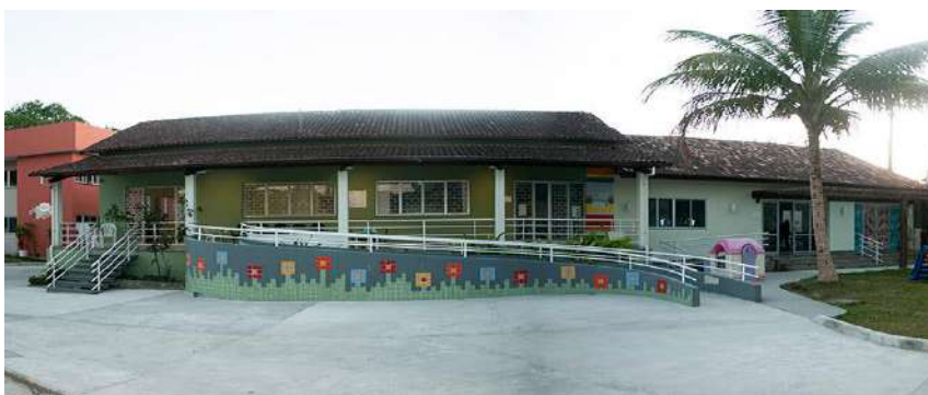
Casa de apoio Clara Kauark

V – Desenvolver atividades , projetos e programa assistenciais, sociais, psicopedagógicos, educativos culturais, recreativos e de lazer para crianças e adolescentes assistidos pelo Gacc Sul Bahia .